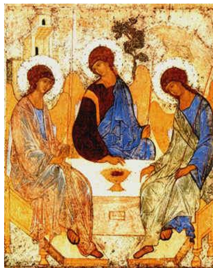
ICÔNE DE LA TRINITÉ N. ROUBLEV

13 juin Alexis Jenni J'aurais pu devenir millionnaire, j'ai choisi d'être vagabond. Une vie de John Muir sur Zoom 11h